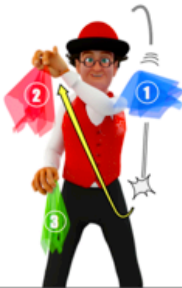
Lancer le deuxième foulards quand le premier commence à descendre