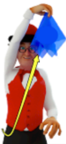
Amener la main droite plus haut que la tête en lancer le foulard