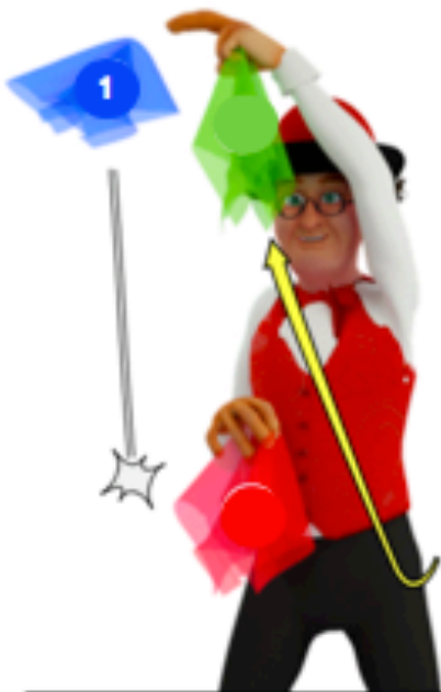
Relancer le premier foulard quand le troisième foulard commence à descendre