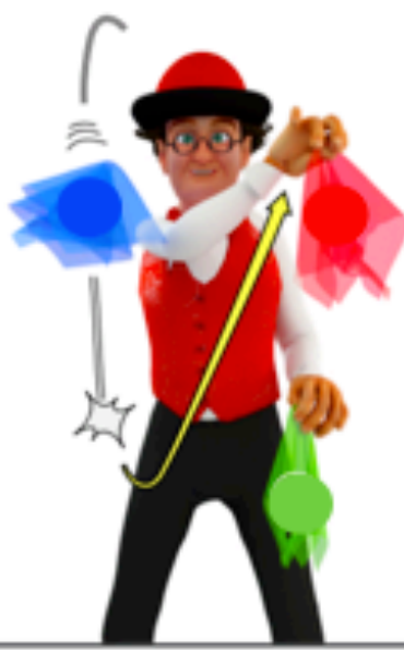
Relancer le deuxième foulard quand le premier foulard commence à descendre