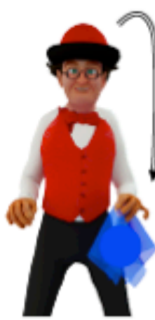
Attraper le foulard avec la main gauche au niveau de la hanche