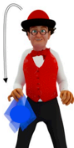
Attraper le foulard avec la main droite au niveau de la hanche