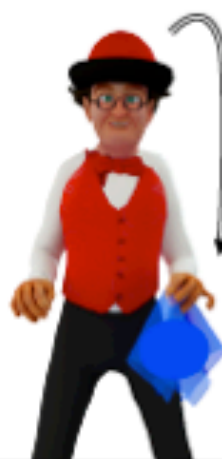
Attraper le foulard avec la main gauche au niveau de la hanche