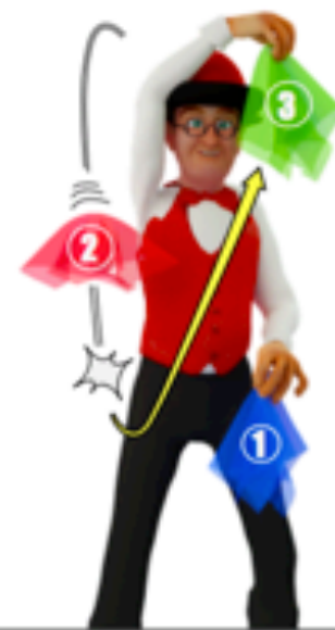
Lancer le troisième foulard quand la deuxième commence à descendre