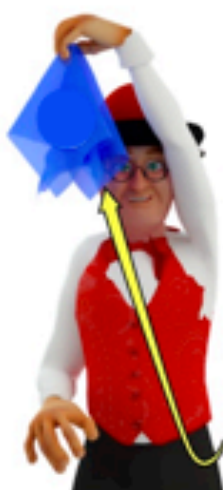
Amener la main gauche plus haut que la tête en lancer le foulard