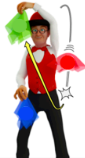
Relancer le troisième foulard quand le deuxième foulard commence à descendre