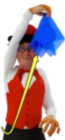
Amener la main droite plus haut que la tête en lancer le foulard