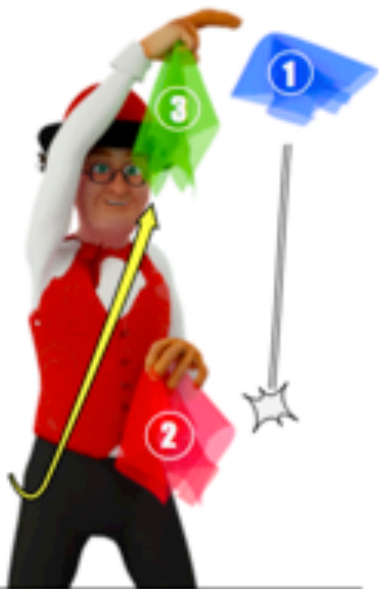
Commencer avec la main qui a deux foulards