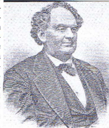
Phineas T. Barnum (1810-1891)